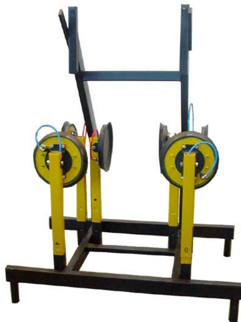
Transportgestell 7003-GTGDS3 mit 6 Verlängerungen (Vorderansicht)