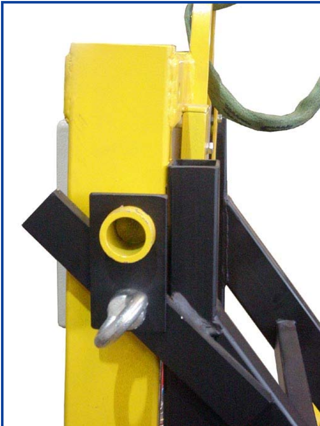
Befestigung des Kombi 7211-DS3 auf dem Transportgestell 7003-GTGDS3 (Seitenansicht)